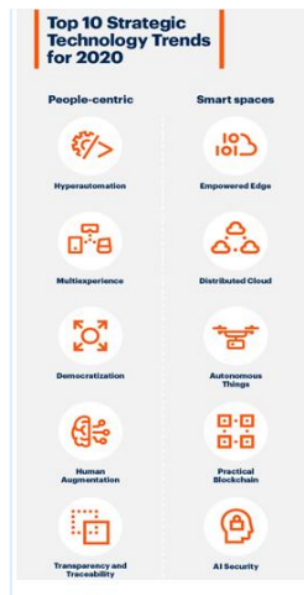
Gambar 2. Tren Teknologi Strategis

Terdapat 10 besar trend teknologi yang strategis yang di tahun 2020 dikelompokkan dalam 2 bidang yaitu: People-Centric dan Smart Space . Implementai teknologi strategis dalam dunia usaha diantaranya: