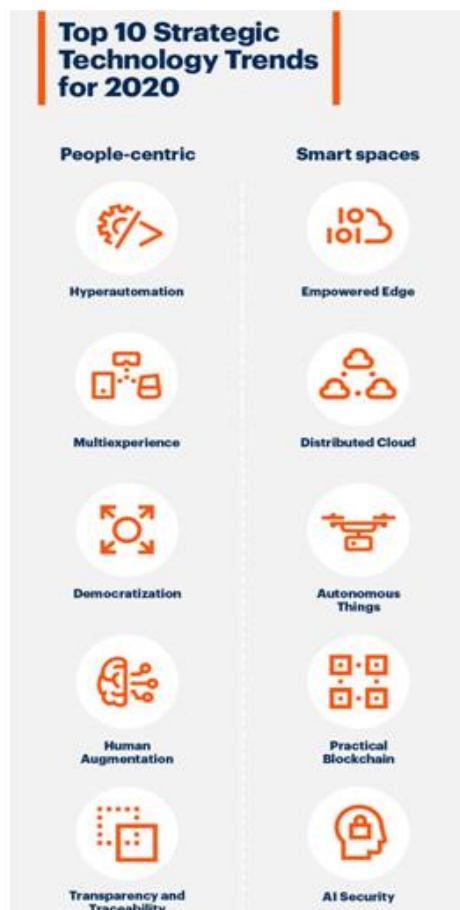
Gambar 2. Tren Teknologi Strategis

Terdapat 10 besar trend teknologi yang strategis yang di tahun 2020 dikelompokkan dalam 2 bidang yaitu: People-Centric dan Smart Space . Implementai teknologi strategis dalam dunia usaha diantaranya: