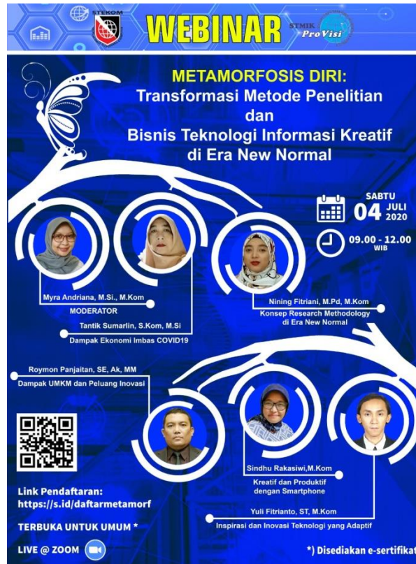
Gambar 1. Pamflet

Untuk menarik minat dan meningkatkan kuantitas peserta, dilakukan kegiatan promosi. Di beberapa saluran sosial lainnya, seperti Facebook, Instagram, Whatsapp, dan situs web universitas, upaya mendiseminasikan pengabdian ini adalah dengan memposting pamflet.