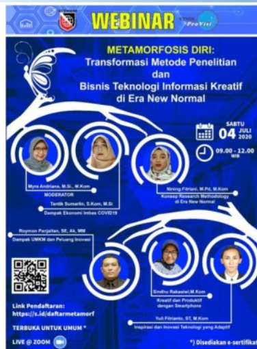
Gambar 1. Pamflet